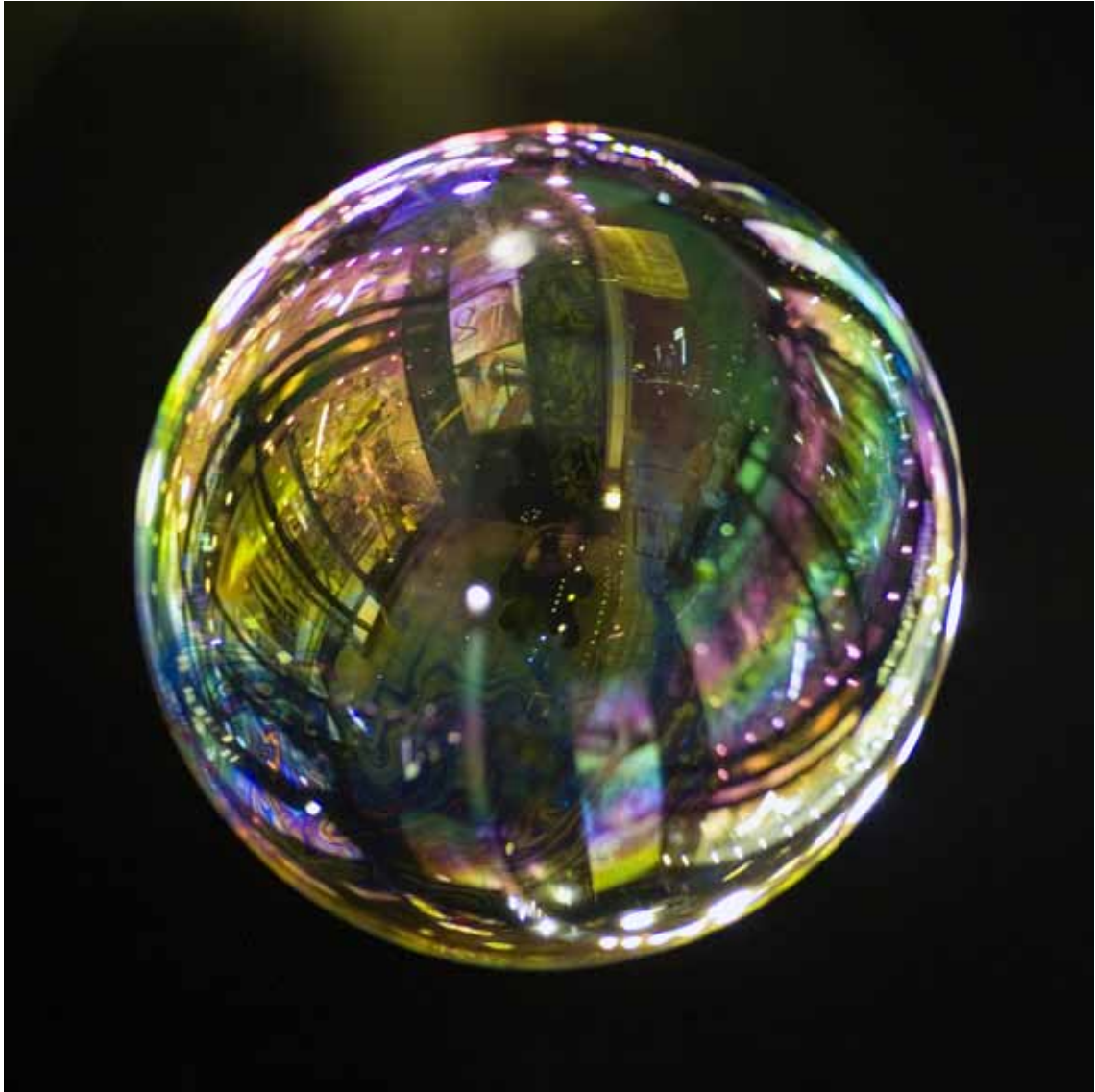
Lingerie , 2011 Lambda-Print on Alu-Dibond 90 x 90 cm, Edition 5