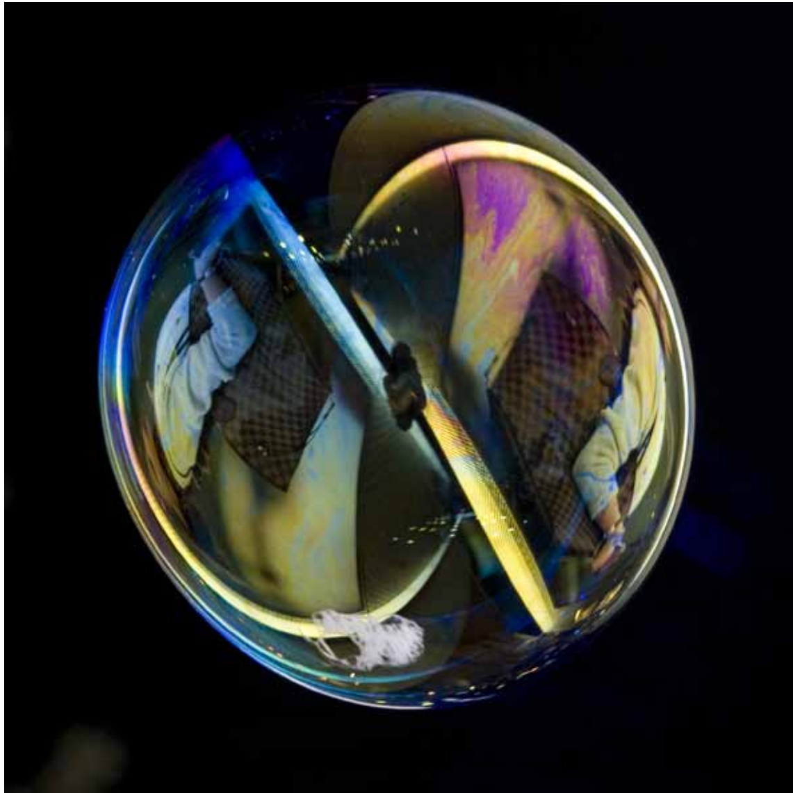
Louis Vuitton , 2012 Lambda-Print on Alu-Dibond 90 x 90 cm, Edition 5