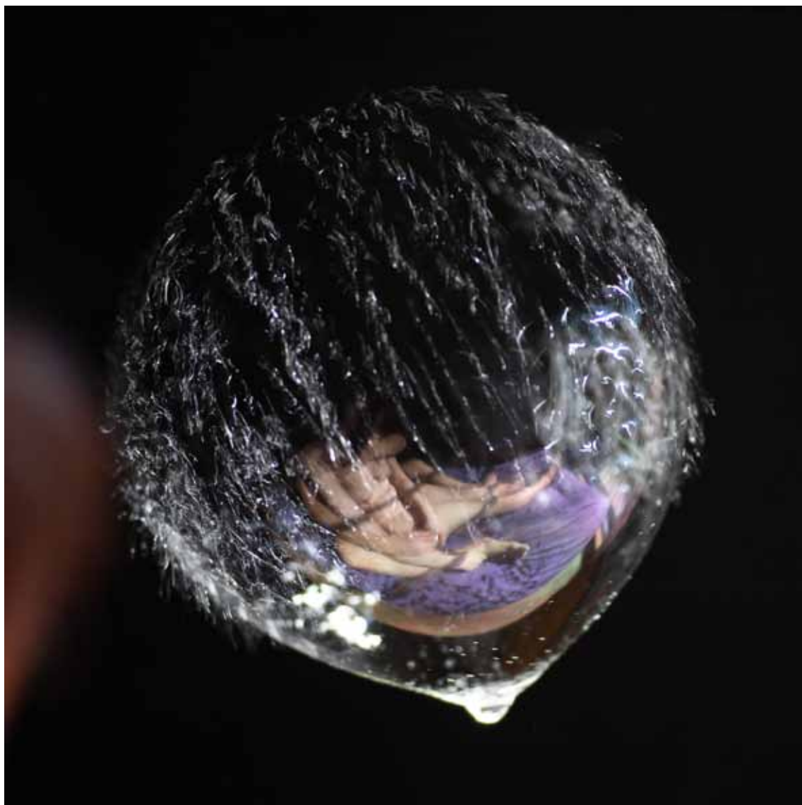
Haletsu , 2012 Lambda-Print on Alu-Dibond 90 x 90 cm, Edition 5