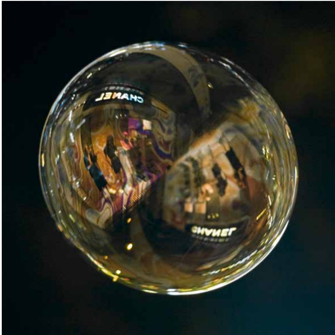
Chanel , 2007 Lambda-Print on Alu-Dibond 90 x 90 cm, Edition 5