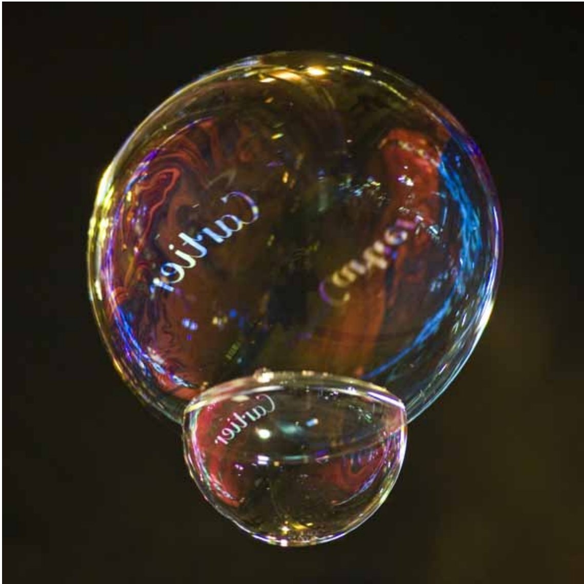
Cartier , 2012 Lambda-Print on Alu-Dibond 90 x 90 cm, Edition 5