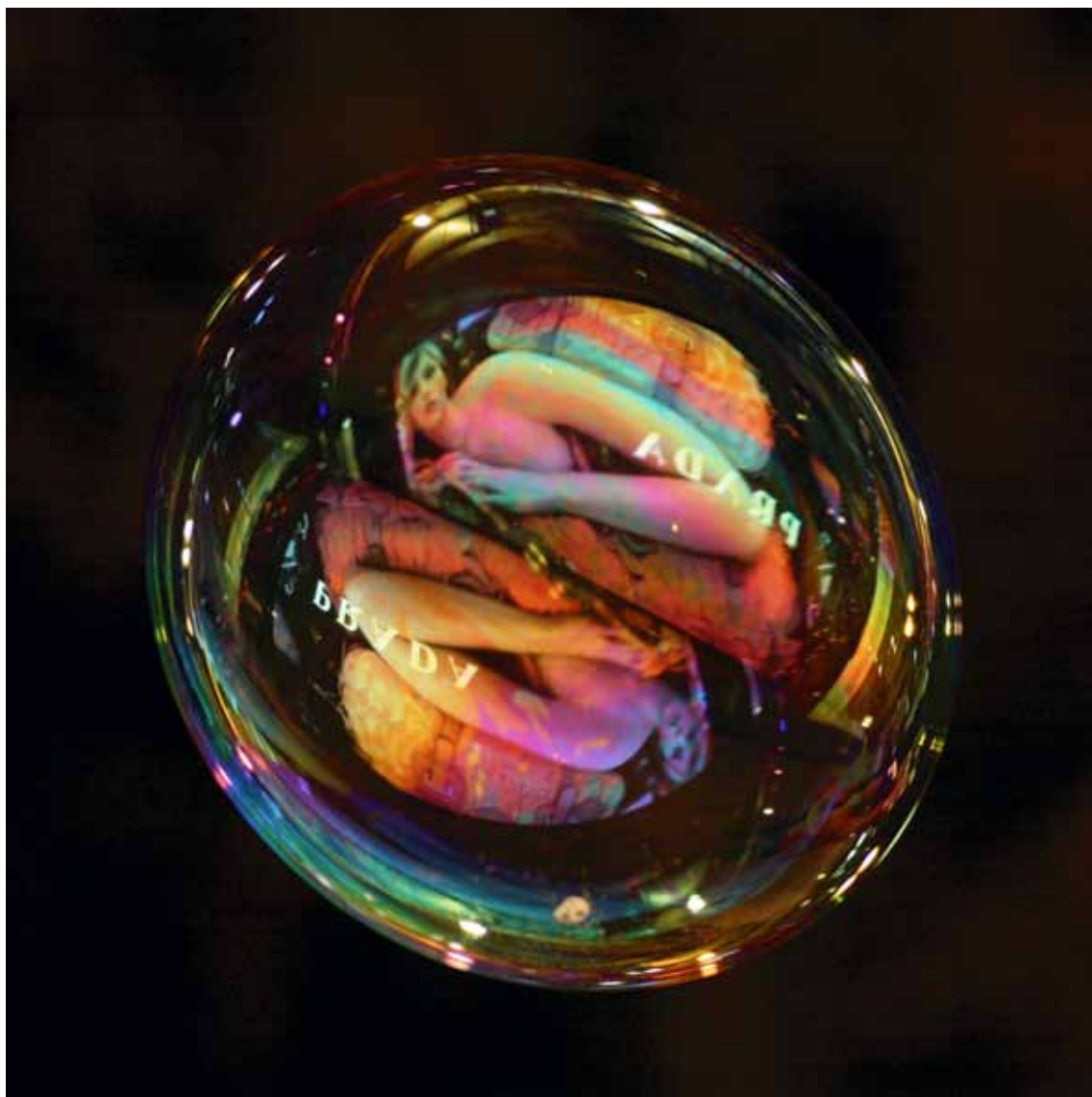
Prada , 2010 Lambda-Print on Alu-Dibond 90 x 90 cm, Edition 5