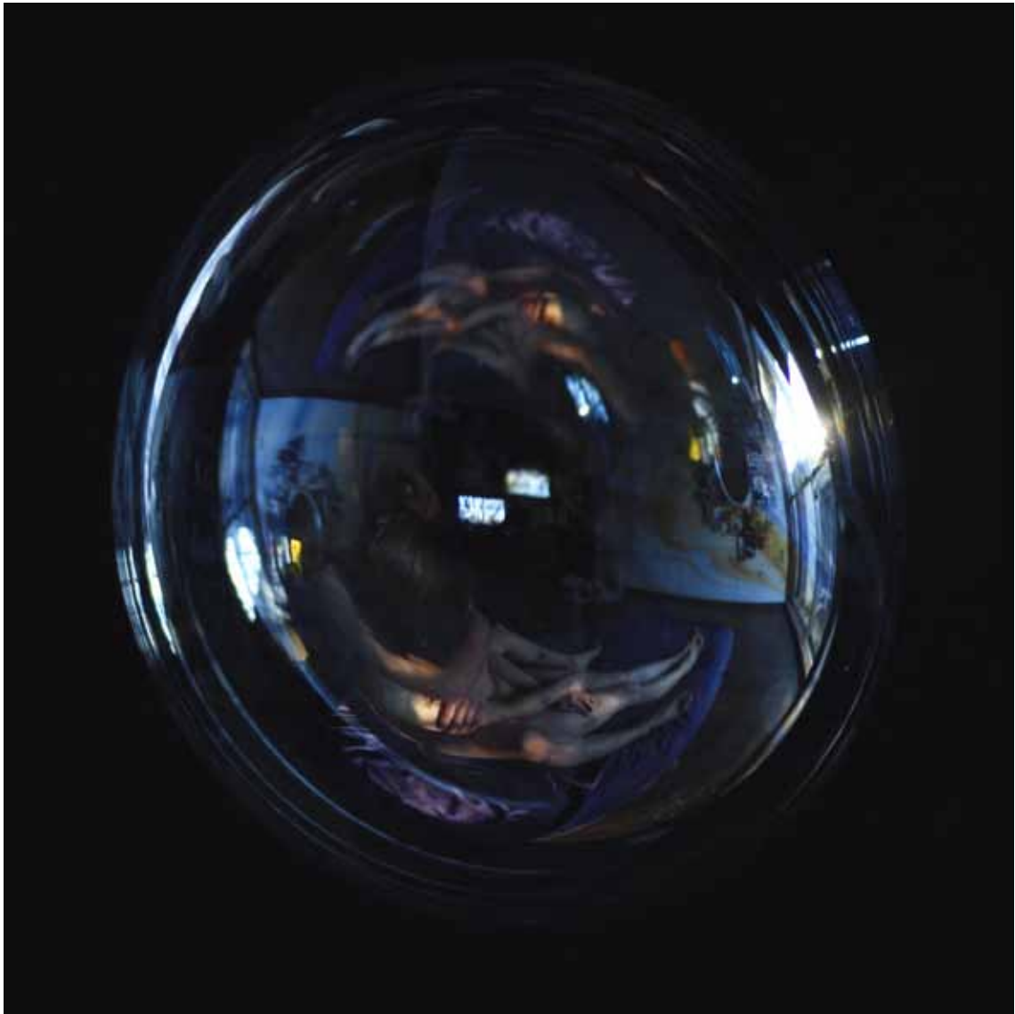
Dusk , 2012 Lambda-Print on Alu-Dibond 90 x 90 cm, Edition 5