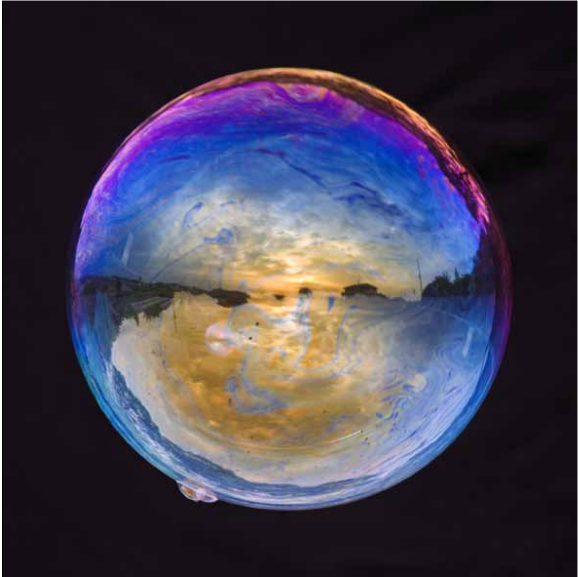
Sunset , 2008 Lambda-Print on Alu-Dibond 90 x 90 cm, Edition 5