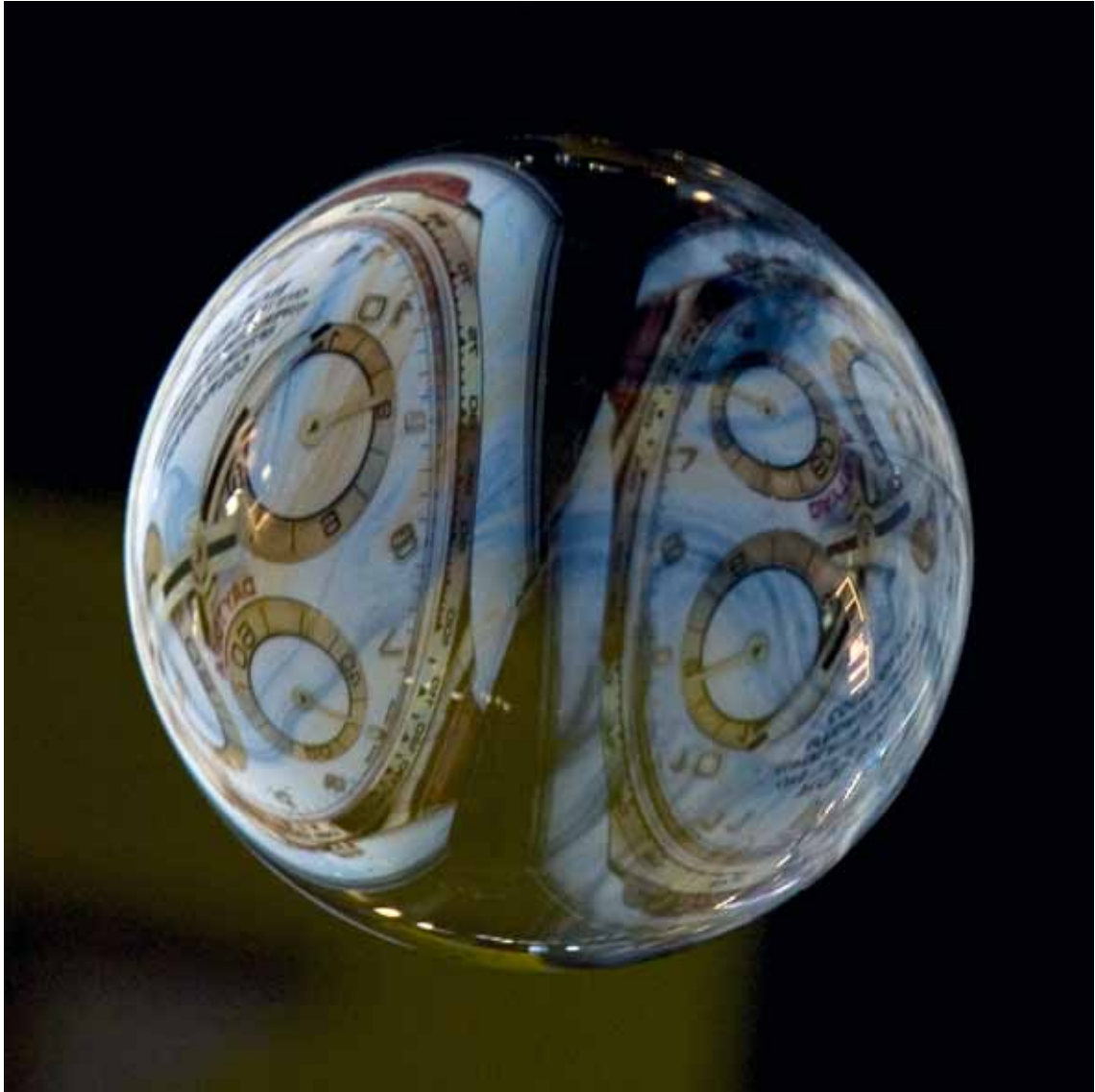
Daytona , 2010 Lambda-Print on Alu-Dibond 90 x 90 cm, Edition 5