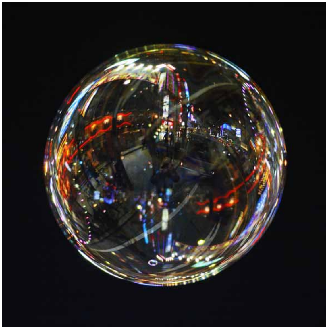
Sakae , 2012 Lambda-Print on Alu-Dibond 90 x 90 cm, Edition 5