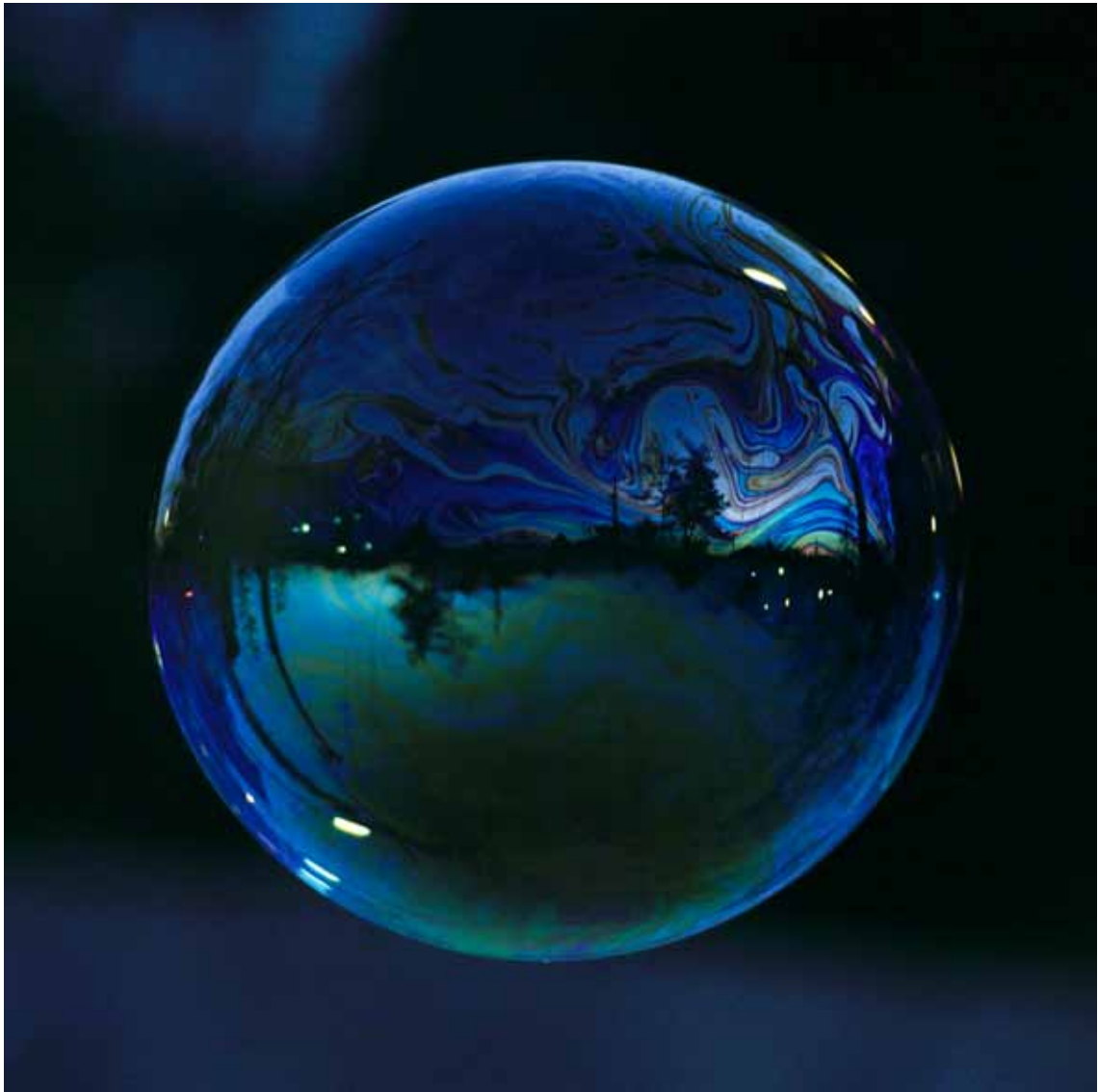
Higashiyama , 2011 Lambda-Print on Alu-Dibond 90 x 90 cm, Edition 5