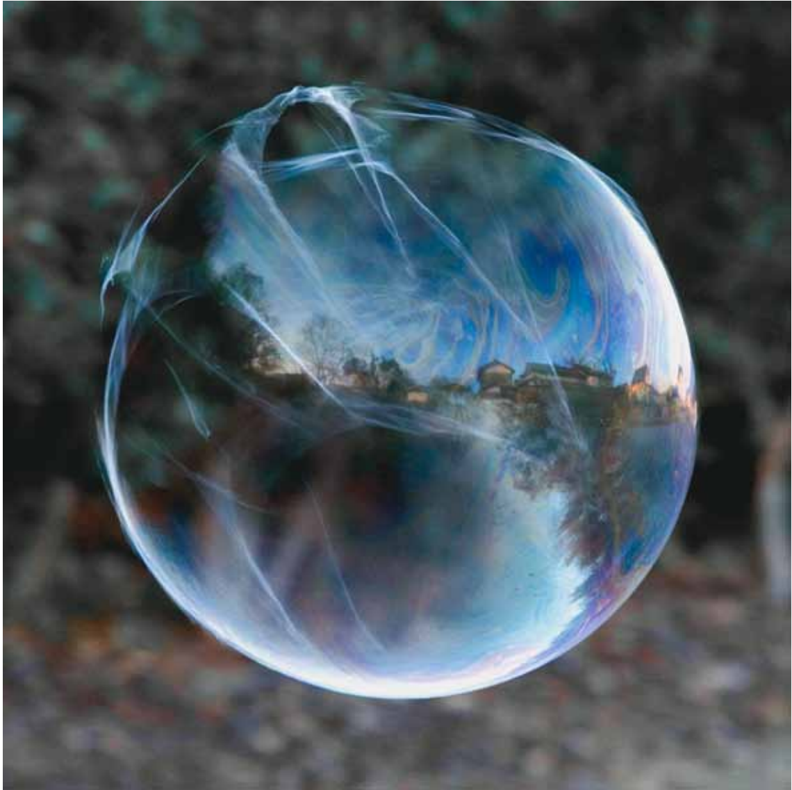
Higan , 2007 Lambda-Print on Alu-Dibond 90 x 90 cm, Edition 5