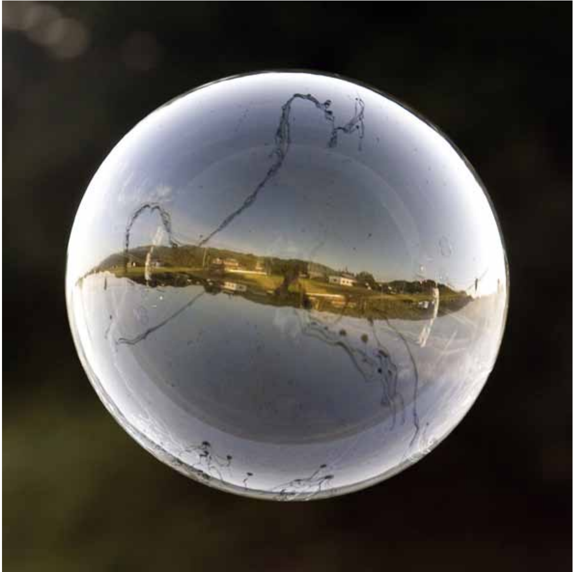
Isle, 2008 Lambda-Print on Alu-Dibond 90 x 90 cm, Edition 5