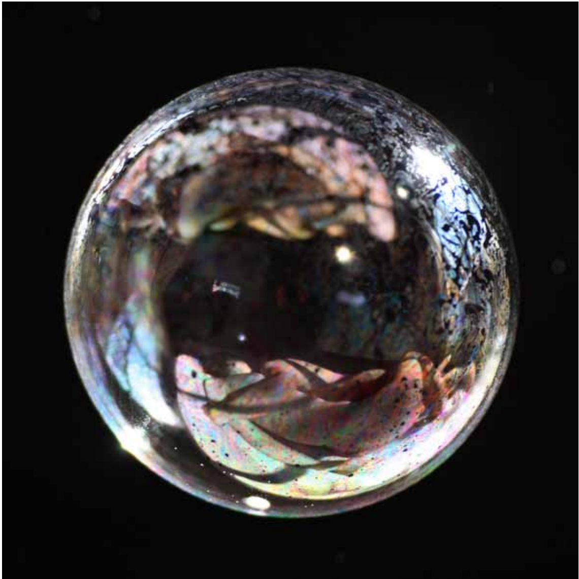
Dawn , 2012 Lambda-Print on Alu-Dibond 90 x 90 cm, Edition 5